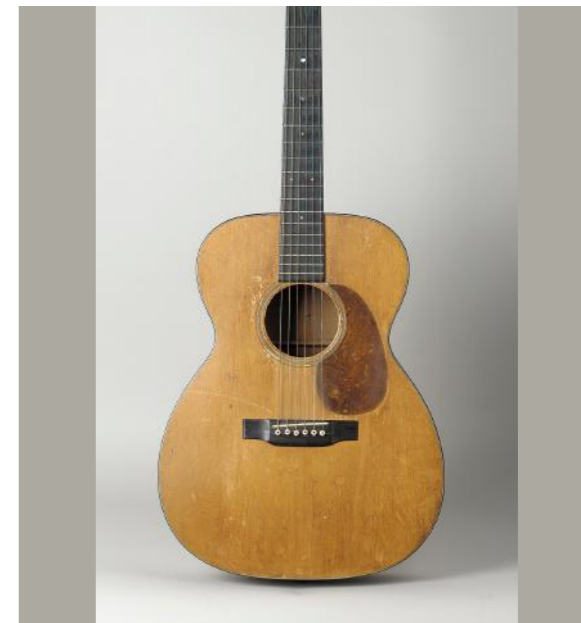
우디 구트리의 마틴 기타, 1937. (EMP 뮤지엄, 시애틀, WA) Woody Guthrie's Martin guitar, 1937. (Courtesy EMP Museum, Seattle, WA)

현대의 관광객이나 방문객이 여행, 선택, 참여를 결정하기 전에 여러 가능성이나 시설, 품질 조사를 위해 디지털 플랫폼을 사용한다는 것은 이미 잘 알려져 있다. 부지런히 연구한 것을 발표하고 해석하는 것, 투명한 사회, 문화, 경제 및 환경 영향 평가, 방문객 편의를 위한 고품질 인프라는 지속 가능한 개발을 보장하기 위해서 타협할 수 없는 부분이다. 이 모든 것은 인도와 한국이 엄청난 약속을 한 UN지속 가능한 개발목표에 대한 벤치마킹이 될 수 있다. 이러한 포괄적인 접근은 인도와 한국의 가치 있고 다양한 유산을 보호하는 데 중요하다. '시멘트와 벽돌' 인프라 개발뿐만 아니라 보존 노력에 대한 투자를 보장하고, 지역 공동체의 범위와 운영 방식 및 주요 이해관계자 참여, 지출 및 이익 공유에 투명성을 제공한다. 가장 중요한 것은 체계적인 감사를 통해 문제를 반성하고 드러내어 대면하는 것이며 그렇게 할 수 있는 수완과 능력이 중요하다. 이를 위해서는 적절한 21세기의 법과 정책이 필요하다. 루트 66 역사의 지정에서 배워야 할 교훈이 있다. 도로, 길, 보도를 따라 남아 있는 역사적인 문화 경관, 한국과 인도의 유적지를 보호하는 것이 급속한 변화 속에서 후손들을 위한 유산이 줄어들지 않도록 보장하는데 중요한 역할을 한다는 것이다.