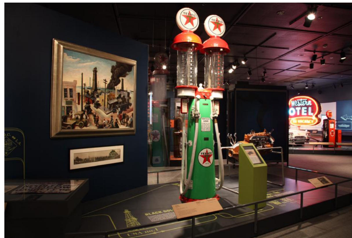
루트 66을 따라 가는 하루의 디자인과 미학이 표현된 길가 기반 시설, 기념품, 주유소 펌프 등 역사적인 컬렉션의 전시 Exhibited are historical collections of roadside infrastructure, memorabilia and even gas station pumps that are marked by the design and aesthetics of the day along Route 66

미 의회는 일리노이 주 시카고에서 캘리포니아 주 산타모니카까지 이어지는 약 2400마일의 길을 루트 66으로 지정하기 위해 국가도로 시스템법의 개정안을 작성하고 있다. 미국 국립공원 관리청은 유산 가치에 대한 발표, 해석 및 관리를 담당하게 된다. 루트 66은 종종 '어머니 도로'라고 불리는 미국에서 가장 잘 알려진 도로이다. 1926년에 최초의 연방 고속도로 시스템의 일부로 개통되었다. 미국 정신의 한 부분이며 미국 동부와 서부를 연결하는 최