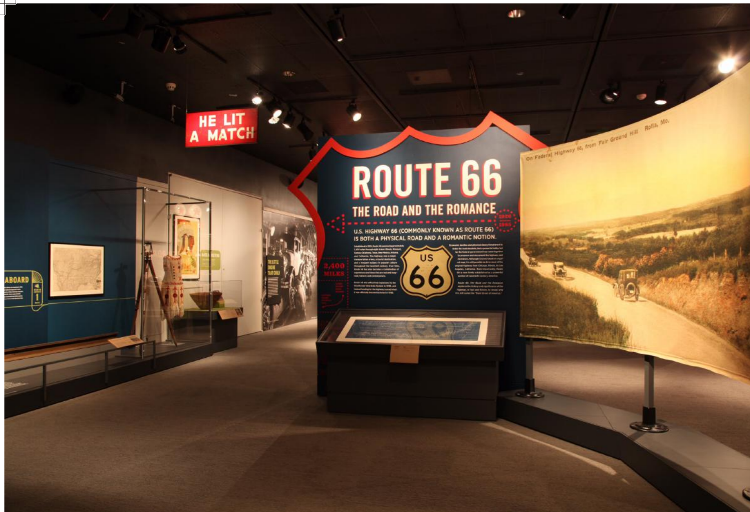
루트 66. 도로와 로맨스. 진 오토리 박물관에서 열린 전시는 인클루시브 박물관에 관련하여 열린 국제회의에서 박물관이 포괄적이 될 수 있는 최선의 방법을 이해하는 데 도움이 되는 예시프로젝트였다. (www.onmuseums.com) Route 66. The Road and the Romance. An enthralling exhibition at the Gene Autry Museum showcased as an illustrative project for understanding how best the institution of the museum could become inclusive during the International Conference on the Inclusive Museum (www.onmuseums.com).